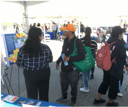
Día de Alviso en la Bahía en San José, 10/14/2023

El equipo del proyecto llevó a cabo más de una docena de eventos presenciales y más de 25 eventos en línea, realizó una encuesta a la comunidad e hizo presentaciones en 15 reuniones de los Comités de la Junta Directiva de VTA. Se proporcionaron materiales en inglés, español, vietnamita y chino en todos los eventos comunitarios, y el equipo del proyecto proporcionó intérpretes en los eventos clave. Más de 1,000 personas participaron en estos eventos y en la encuesta.