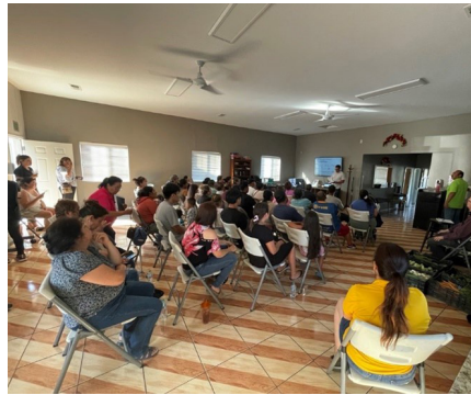
Taller en español en Gilroy, 7/11/2024