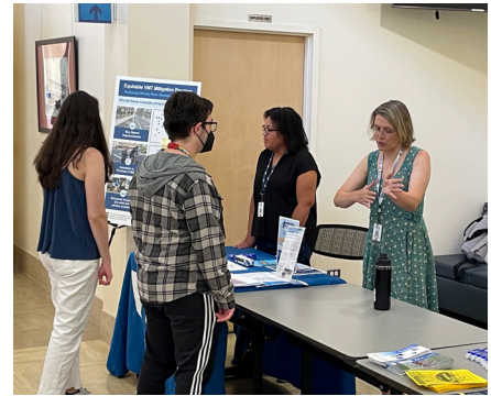
Cumbre de Acción Climática Juvenil SV en Cupertino, 8/3/2024